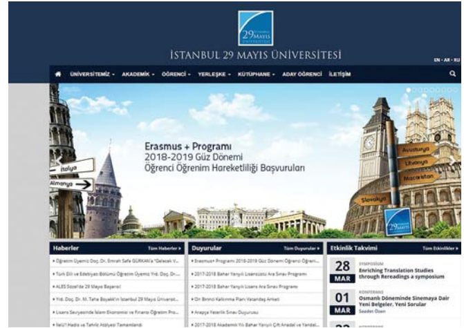
■ Şekil 3. Tanıtım kategorisinde “Uluslararası Değişim Programı” kodlamasına vakıf üniversitesinden örnek.

toplamdan öteye gidebilmesi için kodlar arasındaki ilişkilerin de incelenebileceğini belirtmiştir. Her iki üniversite türü için 8 ana kategoride toplanan kodlar arasında bu tür ilişkiler saptanmış ve frekans belirlenirken de bu ilişkiler göz önünde bulundurulmuştur. Örneğin 1. kategorideki Cinsiyet Temsiliyeti, 4. kategorideki İnsanlar ile kişiserek “Erkek Rektör” ya da “Erkek Öğrenci” temalarını ağırlıklı olarak ortaya koymaktadır. Buna benzer bir başka kişiseme 2. kategori olan “Politik Temsiliyet” ile 3. kategori olan “Önemli Gün Kutlamaları” arasında özellikle Çanakkale Şehitleri Anma günü gibi ulusal değerlerin ve askeri-