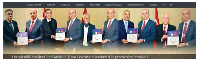
■ Şekil 1. Cinsiyet temsiliyeti kategorisinde “Erkek Rektör ve Tamamen Erkek Temsiliyeti” kodlamasına devlet üniversitesinden örnek.